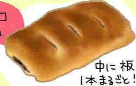
板チョコ デニッシュ

炊いたお米を練りにんでこねた生地は しっとりもちもち、小豆のほよよい甘さでいくらでも 食べられそう