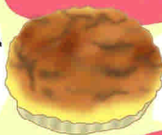
カマンベール・XOパン