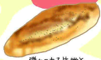
ガーリックフランス

レーズン自体の 美味しさとパン生地の リッチな口味の W交加果で ファンタジー!